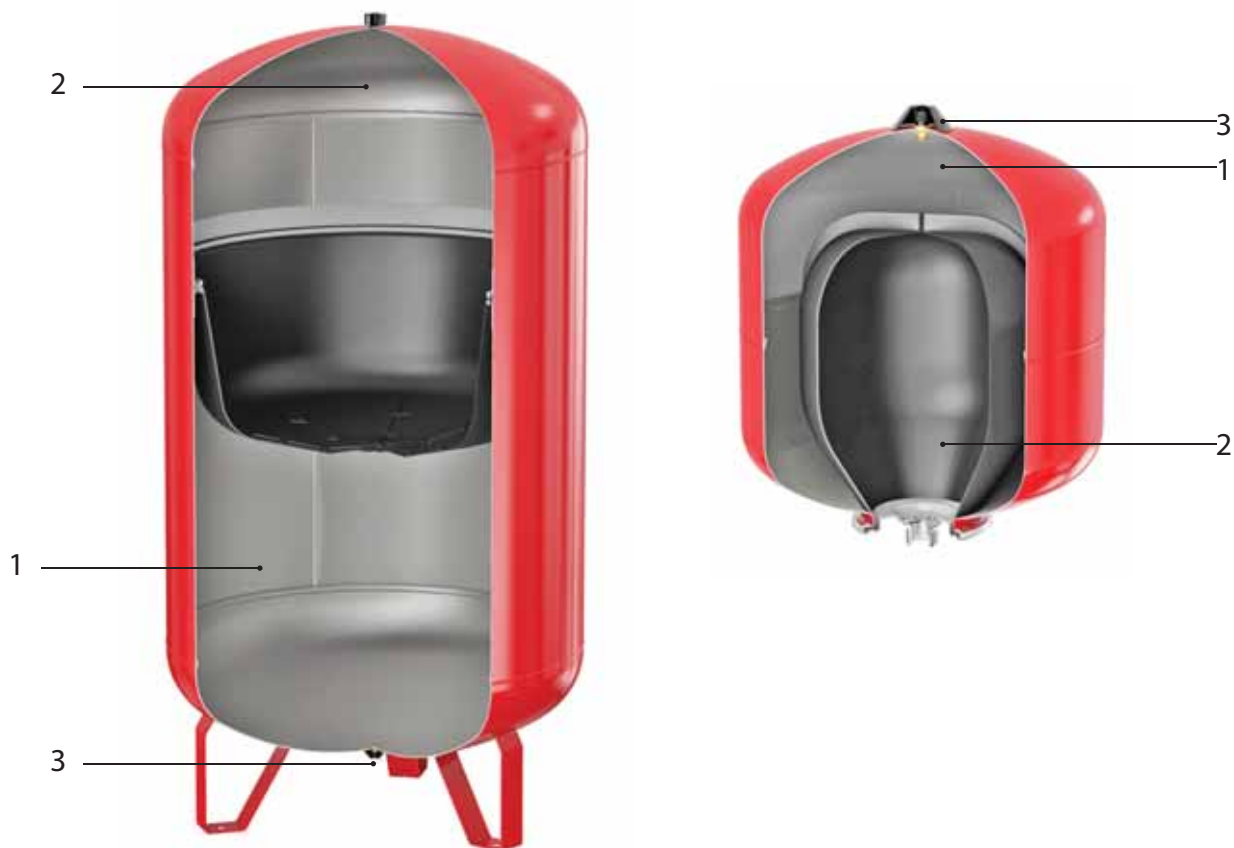
Рис. 1 Мембранные расширительные баки «Гранлевел»

Теплоносителем может служить этиленгликолевая смесь с концентрацией не более 50 %.